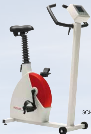
SCHILLER ERG 910S Plus

Los nuevos ergómetros de bicicleta SCHILLER son extremadamente silenciosos, requieren un mantenimiento muy reducido y son fáciles de utilizar. Los ergómetros SCHILLER se han diseñado con arreglo a las directrices europeas sobre ergómetros médicos.