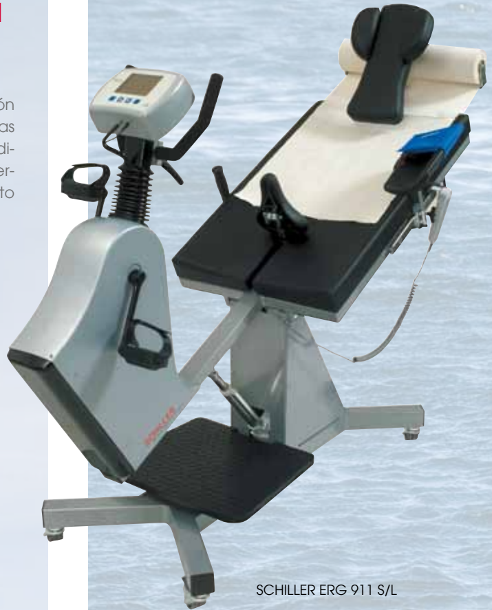
SCHILLER ERG 911 S/L

El nuevo ergómetro de seguridad de banco/semi-sillón SCHILLER ha sido desarrollado y fabricado con arreglo a las directivas europeas más recientes para ergómetros médicos. Es particularmente adecuado para pruebas de esfuerzo y cateterismo cardíaco, así como para pacientes de alto riesgo, personas mayores o discapacitadas.