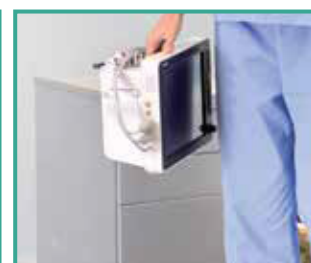
Protección contra caídas