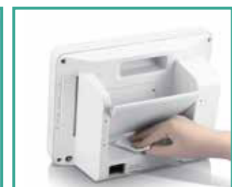
Compatible con múltiples agentes de limpieza