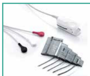
Accesorios de alta calidad