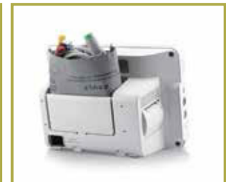
Gabinete exclusivo para accesorios