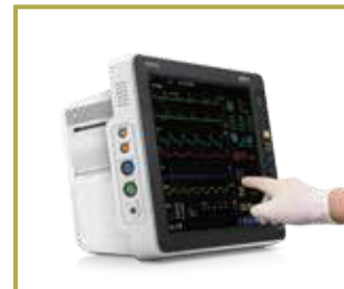
Interfaces fáciles de usar