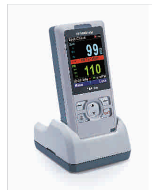
Stand de Cargo