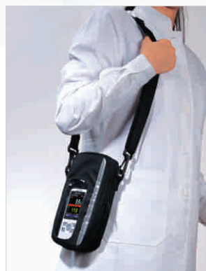
Caja de Transporte