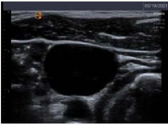
Yugular Interna con Carotida