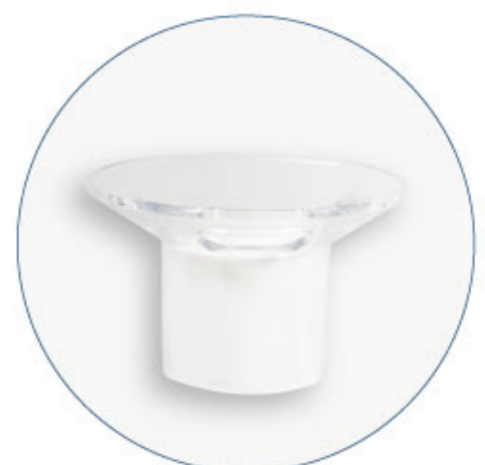
Dilatador Anal Circular