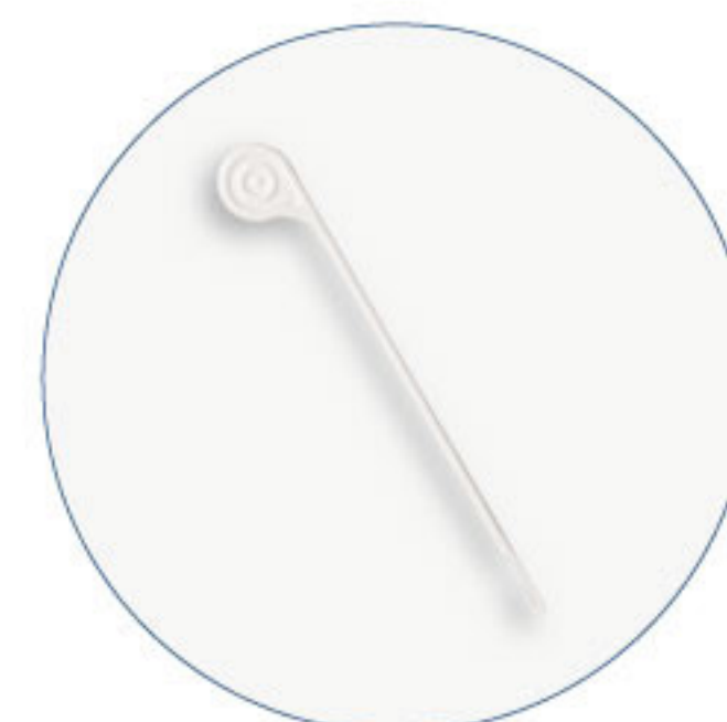
Enhebrador de sutura