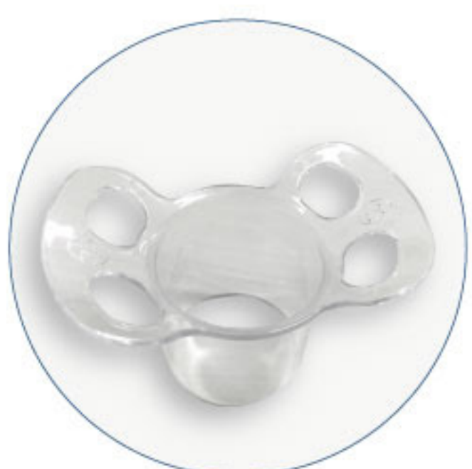
Dilatador Anal Mariposa

Diseño patentado: seguridad dual, previene activación accidental para mayor seguridad