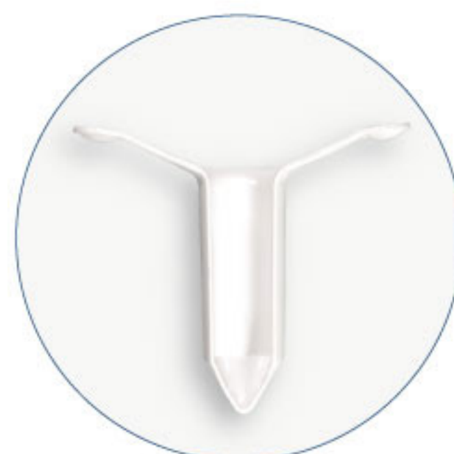
Anoscopio de sutura de jareta