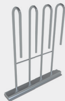
Soporte para balón