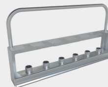
Soporte para tráqueas (hasta 36 unidades)