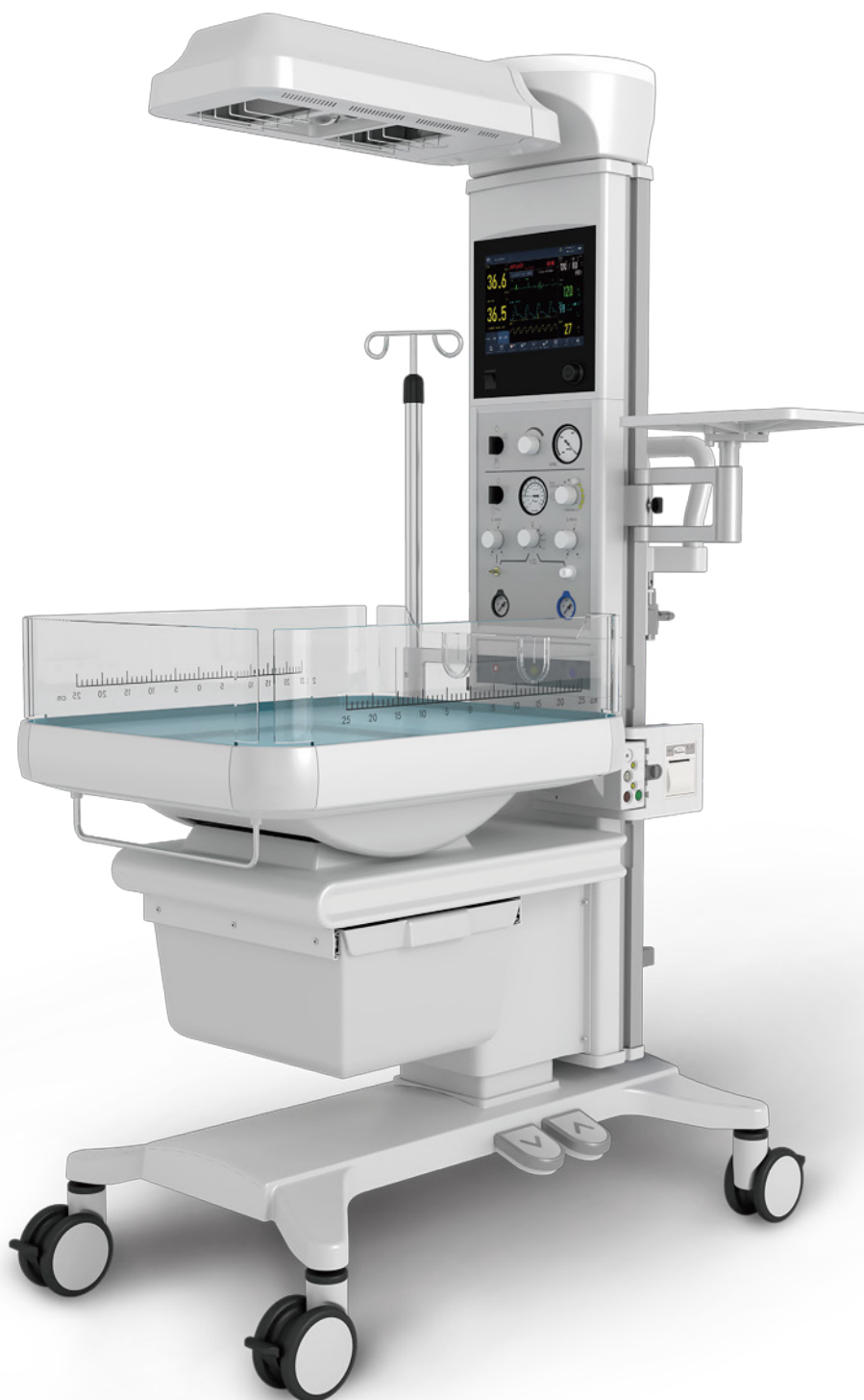
BQ80 Calentador radiante infantil