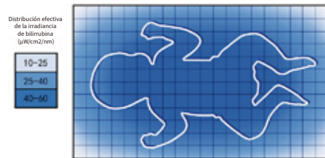
Gráfico de distribución de irradiancia espectral

Nuestro innovador diseño óptico asegura una distribución uniforme de la irradiancia, minimiza la exposición y la luz de derrame, con luz LED que cubre uniformemente la superficie corporal total de los recién nacidos para garantizar el efecto de la fototerapia.